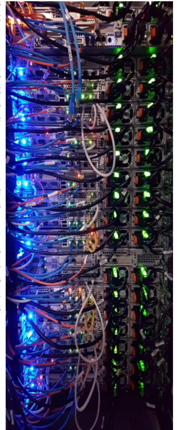
Fait à Abidjan, le 17 février 2021

- Encourager les opérateurs audiovisuels à engager des poursuites pénales contre les revendeurs d'abonnements et/ou matériels permettant le piratage des contenus audiovisuels par Internet.